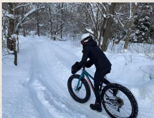
Et c'est parti mon kiki!