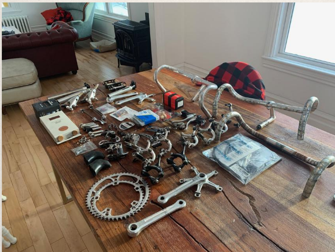
Une partie de l'inventaire.... Le matériel n'est pas encore 100% présent. Une belle diversité : Campagnolo, Gipiemme, Cinelli, Modolo, ....

La semaine prochaine en fin d'hebdo vous aurez une liste des sites que nous avons consultés. Avec des photos plus détaillées des pièces choisies par chacun de nous.