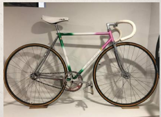
Un Argon 18 Piste, bien avant Gervais Rioux. De l'époque Eurocycle!