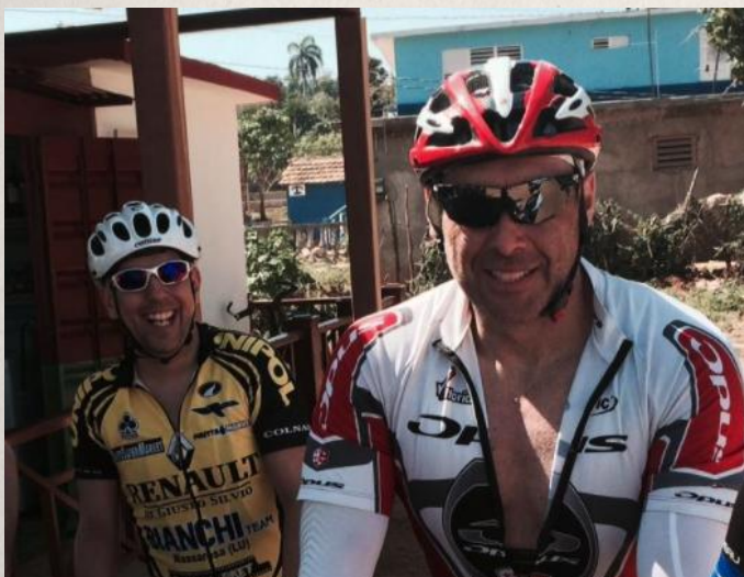
Bruno et La légende lors de leur nombreux voyages à Cuba.

P.S. : Merci encore de nous avoir offert quelques pièces Campagnolo (Crankset et dérailleur)