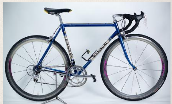
Le Marinoni de son enfance refait à neuf