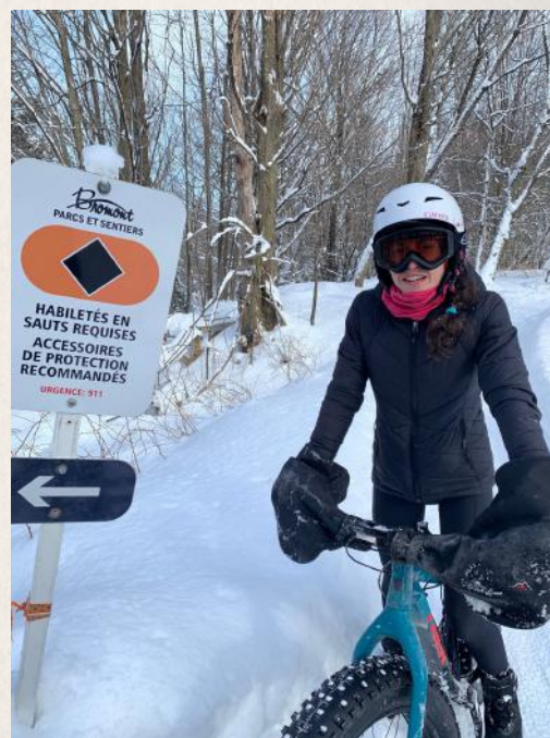
Petite pause avant de se lancer dans la Yakattack!