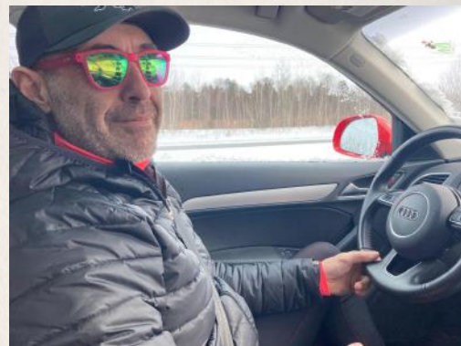
Après 2 cafés, la légende est ready to rumble !

P.S. : Les sandwiches de la boulangerie sont dans le "pas pire", et le café fait avec la méga Rancillo aussi.... Juste au cas où la fringale de fin parcours vous prends.